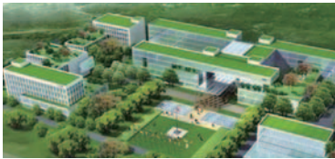
利用科學化管理，技術改進通過綠色建築及施工達到低碳及綠色環保的目的。

我們尋求把握綠色建築及綠色新能源的商業機會，以便為股東獲得更高回報。本集團亦致力於響應國家政策，以碳中和的理念，進一步利用科學化管理及技術改進通過綠色建築及施工達到低碳及綠色環保的目的。我們致力於結合我們的現有建築及建築相關業務，通過光伏新型發電系統及儲能技術踐行綠色發展理念，營造節能及可持續的生活環境。