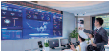
提供智能化物業管理服務，形成安全，舒適，便捷，節能，可持續發展的生活環境。