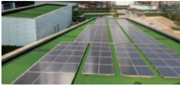
結合建築與地產，通過光伏新型發電系統及儲能技術服務踐行綠色發展理念。